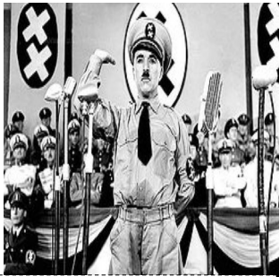
チャップリンの独裁者

国民が無権利にされた時代が戦前でした。天皇の名のもとに戦争に徴兵され、財産も簡単に奪われました。子供を生むことは「お国のため」と云われました。個人のためではなく労働者を増やし兵隊に行く若者がほしかったのです。障害者が「こくつぶし」とさげすまれました。ナチスのドイツとなにも変わりません。ユダヤ人を根絶やしに