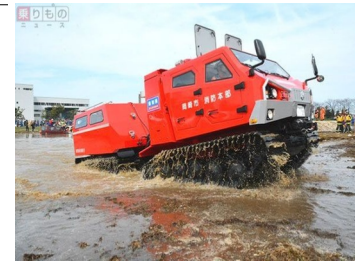
1台 1億1千万円 オスプレイ1機分で全府県に配備