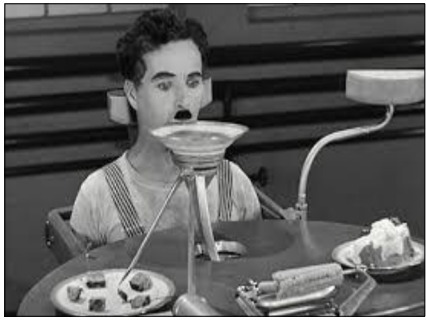
モダンタイムス (チャップリン)

議員辞職を求める声に二階幹事長は「本人の考え方だ」と自民党の方針と真つ向違う発言にも関わらず責任を求めています。